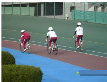
▲地域スポーツ体験

上級学校見学，職業講話，模擬面接 地域企業見学，地域ビジネス実習 上級学校出前講義，視覚障がい者の理解 地域スポーツ体験，地域の食と文化を学ぶ 講座 など