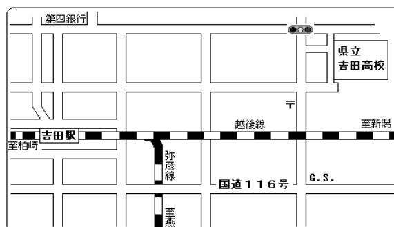
吉田駅から徒歩15分 北吉田駅から徒歩10分