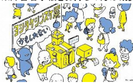
展覧会メインビジュアル(部分)

※( )内は有料20名以上の団体料金 ※県内高校生は、授業等の場合、事前申請により、観覧料が免除となります。 ※障害者手帳をお持ちの方は観覧料が免除になります。手帳を御提示ください。