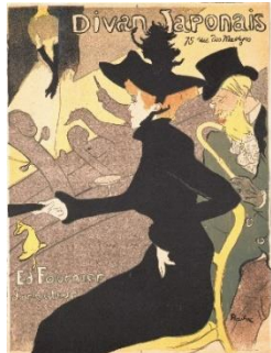
アンリ・ド・トゥールーズ=ロートレック 《ディヴァン・ジャポネ》1892年