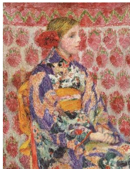
児島虎次郎 《和服を着たベルギーの少女》1910年 高梁市成羽美術館蔵