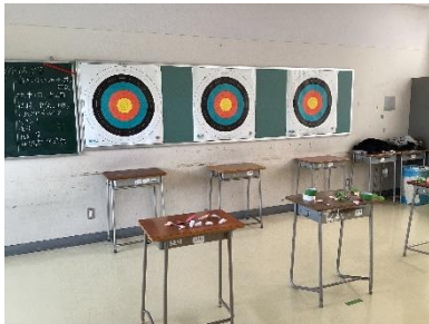
1組「あ～、チャイムなっちゃった」

今月の2日(木)には、吉高祭がありました。クラス企画準備の段階では、なかなか話が進まず、担任は気をもみましたが、数日前から後片付けまでは、各クラスとも協力して、楽しみながら参加していました。また学年企画として、修学旅行先の「京都や広島はなぜ賑わっているのか」の探究発表展示もおこないました。その他、授業作品展示や生徒会・部活動企画など、皆さんの活躍が見られた一日でした。