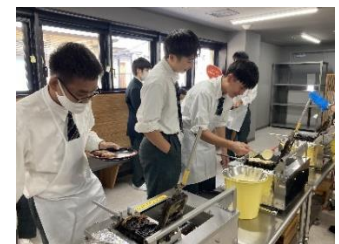
もみじ饅頭焼き体験